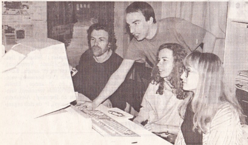
Joindre l'utile à l'agréable