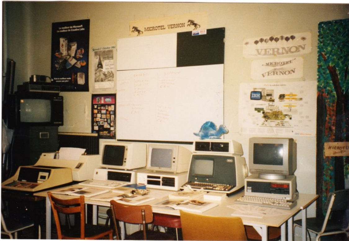
L'exposition des vénérables ancêtres