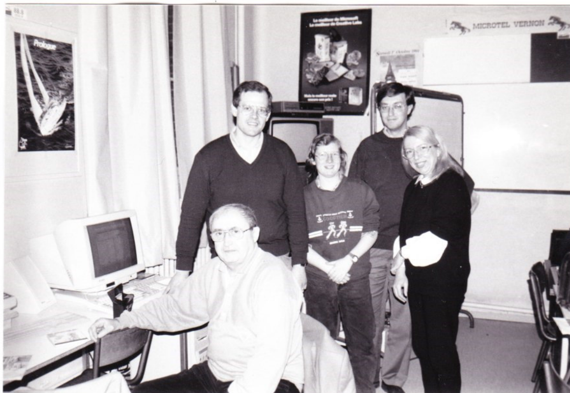
Les membres du Bureau, moins un...