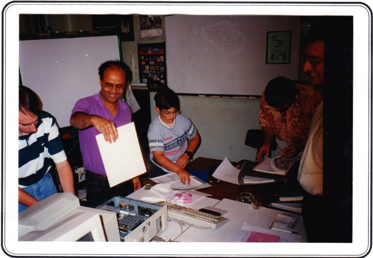
La résurrection du Compaq