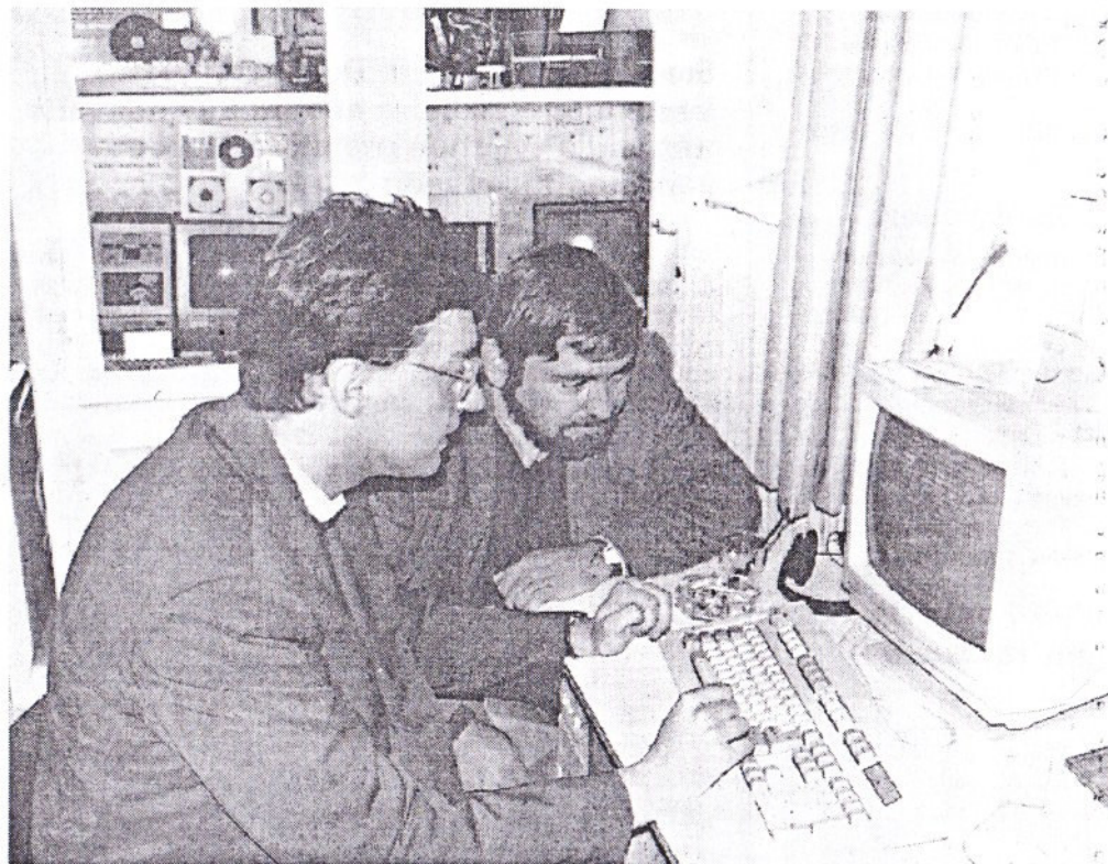
L'informatique pour tous au club Microtel

En fait, tout adhérent à jour de sa cotisation a libre accès au club. Il dispose d'une carte pouvant être échangée contre une clé de la salle. Cela lui permet de travailler sur du matériel varié, avec notamment des machines à traitement de textes. Un logiciel PAO (programme assistée sur ordinateur) est aussi disponible.