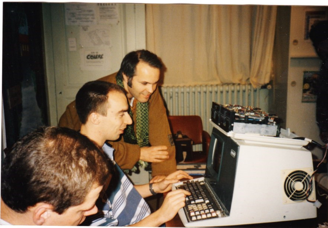
Et ça marche !!!