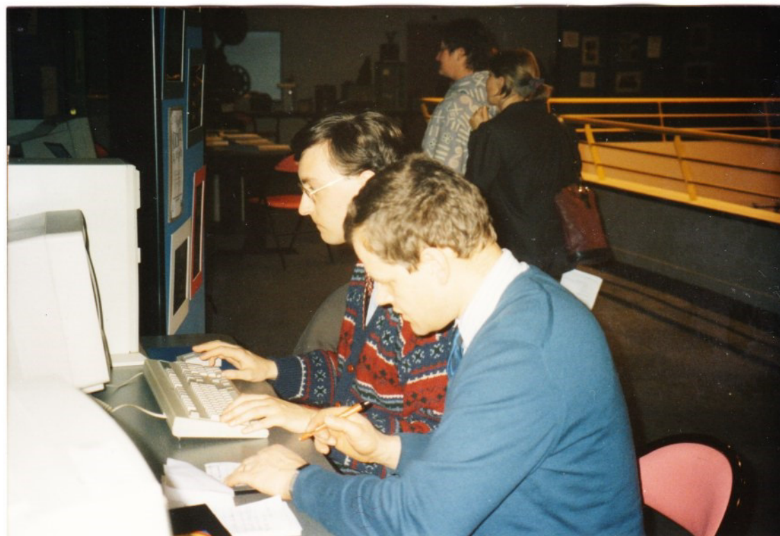
Gestion informatique du concours