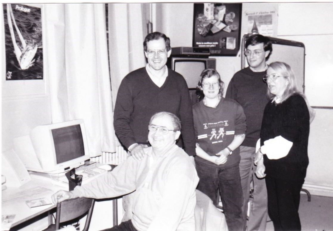
Président et Vice-président, toujours en forme...