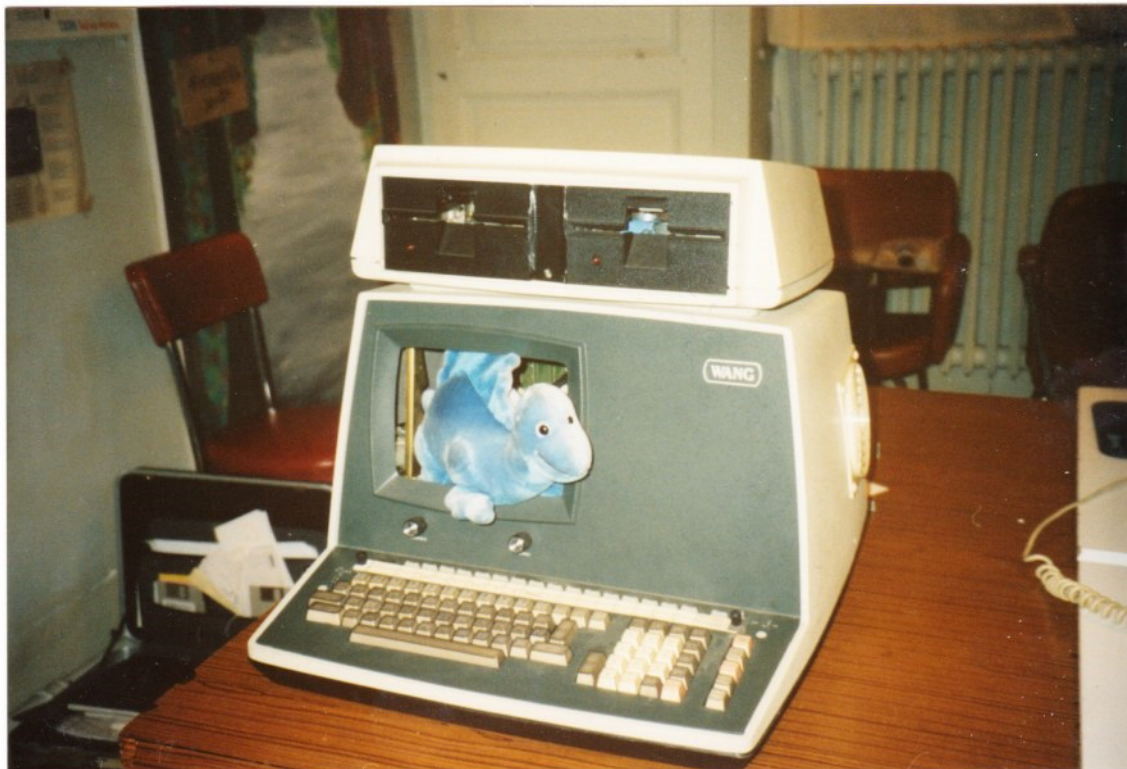
Restauration d'un dinosaure