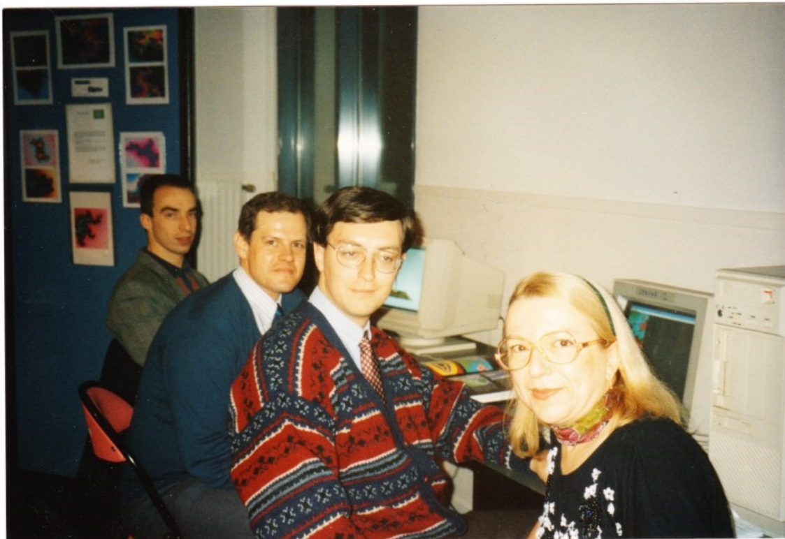
Une belle brochette d'..... De quoi déjà ?