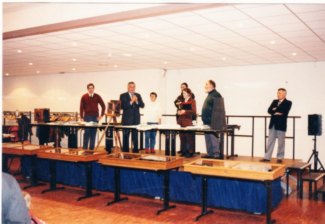
Le discours de Monsieur le Député-Maire