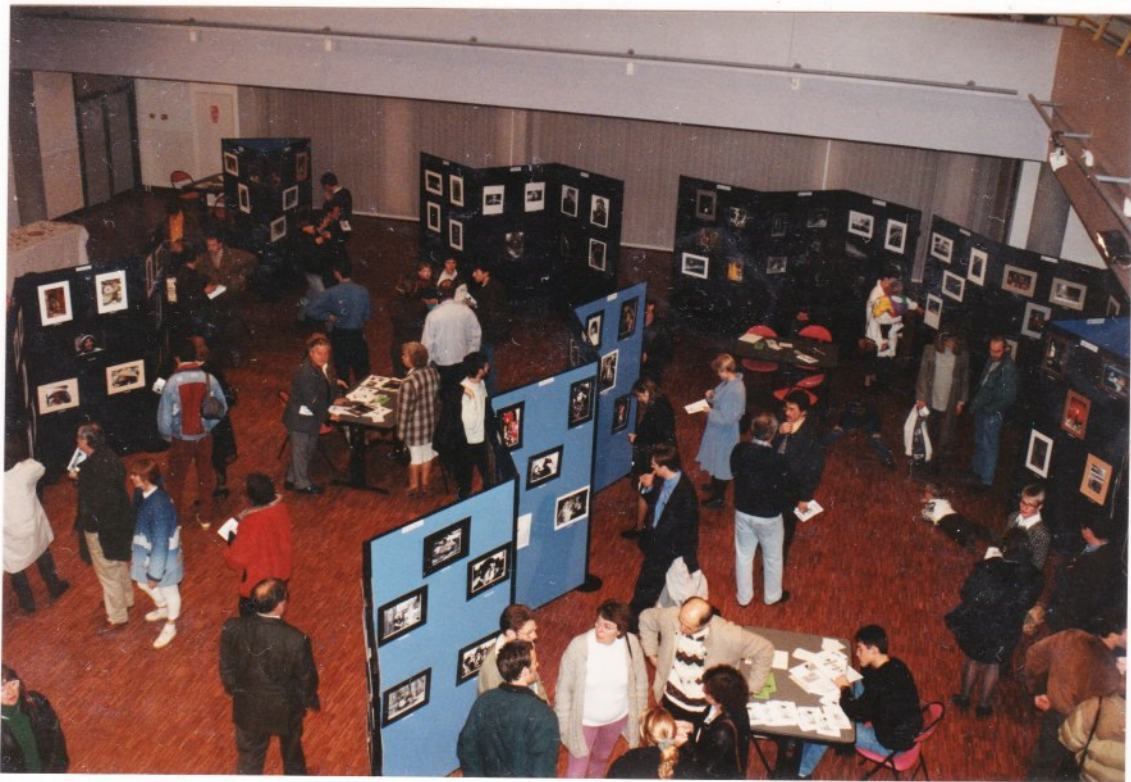
L'Exposition du rez-de-chaussée