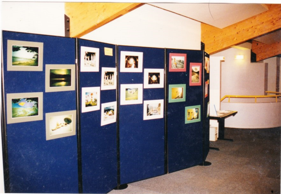
Notre présentation de photos retouchées