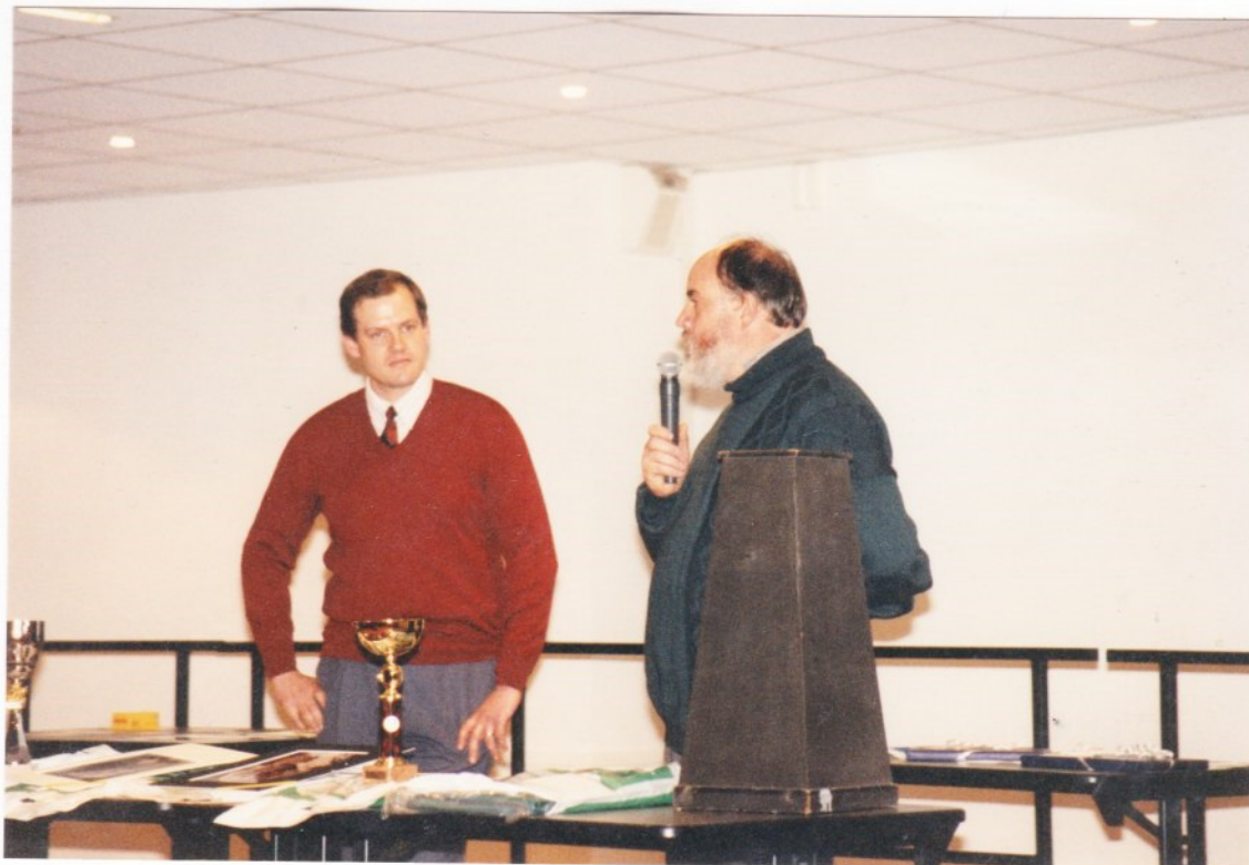
Les discours des Présidents