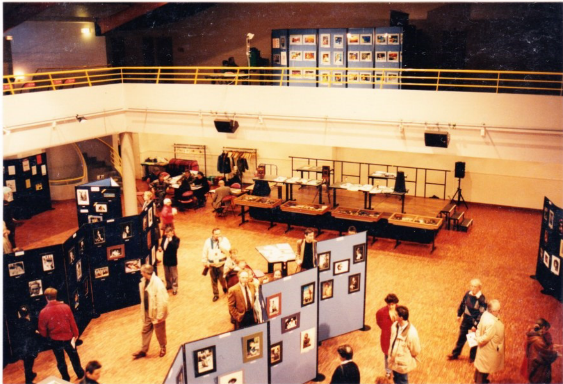
L'Exposition du rez-de-chaussée