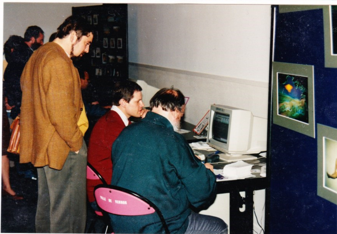
Deux présidents plus un ex..... !