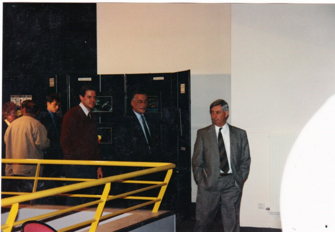
Le Président escortant les membres du Conseil