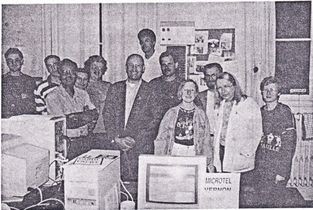
L'équipe du Microtel

486 dx 33, carte sonore Adlib, écran VGA, autant de termes qui font peur à toute personne qui n'y entend rien au domaine de l'informatique. Et face à ce langage qui se développe dans le domaine professionnel ou scolaire (car depuis quelques années, les micro ont fait leur apparition dans les écoles). Le club Microtel de Vernon vous invite à dompter ces gentilles bêtes que l'on appelle ordinateur. Voyage au pays des mordus du PC.