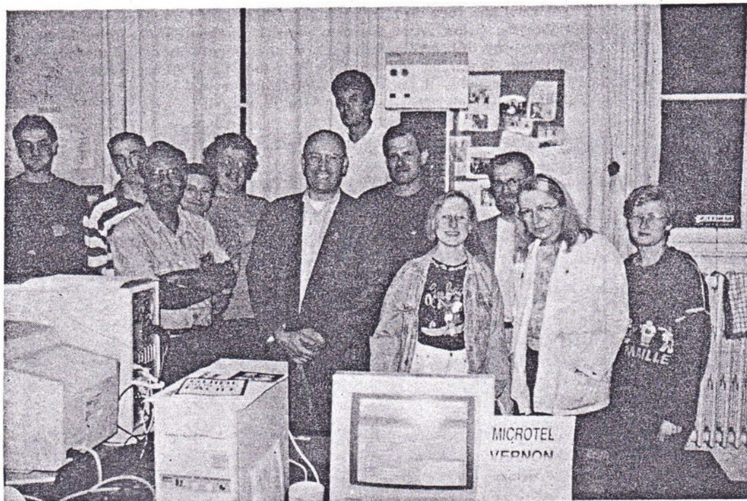
L'équipe du Microtel

486 dx 33, carte sonore Adlib, écran VGA, autant de termes qui font peur à toute personne qui n'y entend rien au domaine de l'informatique. Et face à ce langage qui se développe dans le domaine professionnel ou scolaire (car depuis quelques années, les micro ont fait leur apparition dans les écoles). Le club Microtel de Vernon vous invite à dompter ces gentilles bêtes que l'on appelle ordinateur. Voyage au pays des mordus du PC.